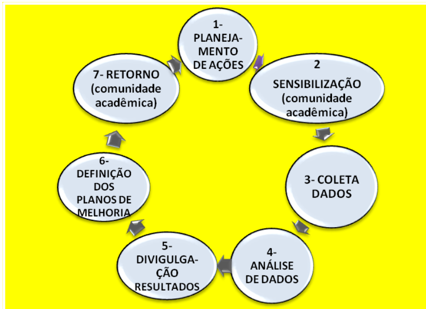
Figura 2 - Estrutura de Autoavaliação

O processo de autoavaliação obteve uma grande evolução, saindo do formulário impresso para o ambiente virtual, implantado ao longo do triênio, com todos os segmentos da comunidade acadêmica. No Quadro 1- E estrutura da autoavaliação é demonstrado o fluxo das ações do processo de autoavaliação da FMH.